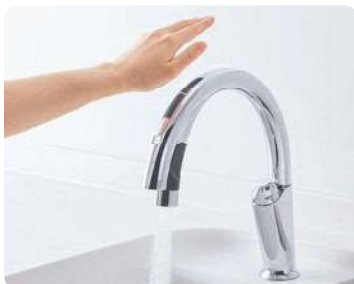
ナビッシュハンズフリー