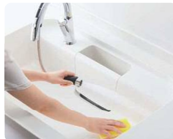
ナビッシュハンズフリー