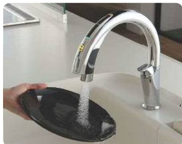
ナビッシュハンズフリー